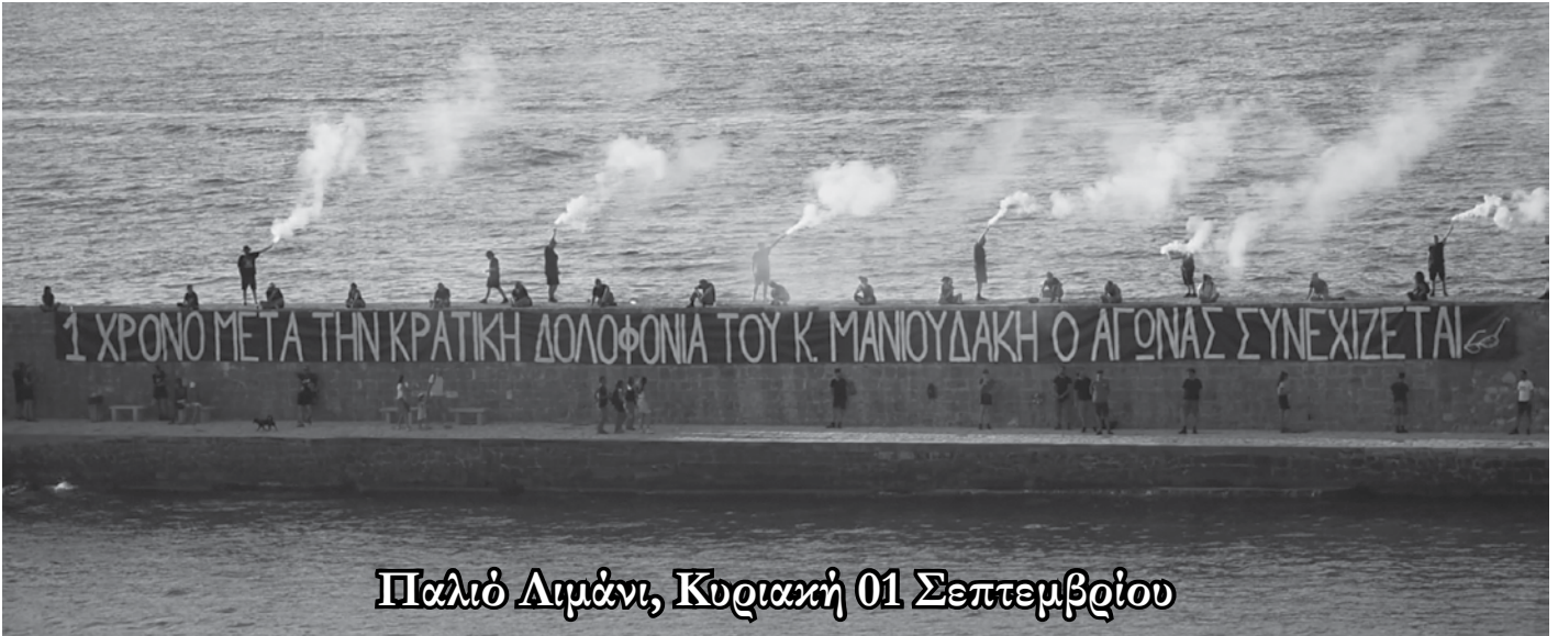
Παλιό Λιμάνι, Κυριακή 01 Σεπτεμβρίου

Το απόγευμα της ίδιας μέρας, δεκάδες συντρόφια κάναμε παρέμβαση στο Παλιό Λιμάνι, όπου αναρτήσαμε γιγαντοπανό 50 μέτρων στον λιμενοβραχίονα που καταλήγει στον Φάρο, με το σύνθημα « 1 χρόνο μετά την κρατική δολοφονία του Κώστα Μανιουδάκη, ο αγώνας συνεχίζεται ». Κλείσαμε, έτσι, το τριήμερο, επαναλαμβάνοντας πρωτίστως στην τοπική κοινωνία, αλλά και προς πάσα κατεύθυνση, πως η ανοιχτή συνέλευση για την κρατική δολοφονία του Κώστα Μανιουδάκη θα συνεχίσει ακάθεκτη να αναβαθμίζει τη δράση της με συνέπεια και μεθοδικότητα.