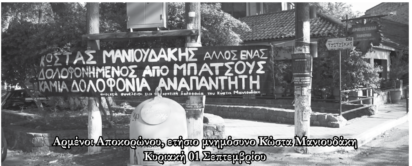
Αρμένοι Αποκορώνου, ετήσιο μνημόσυνο Κώστα Μανιουδάκη Κυριακή 01 Σεπτεμβρίου

Ξεκινώντας από την ίδια την οικογένεια, προχωρώντας στην ανοιχτή συνέλευση σε Χανιά και Αθήνα και τις πρωτοβουλίες που έχουν συσταθεί σε πολλές πόλεις για τη συγκεκριμένη υπόθεση, ο ισχυρισμός μας έχει διαχυθεί όχι μόνο στον χώρο, αλλά και στον χρόνο με σταθερή παρουσία στη δημόσια σφαίρα. Είναι πλέον αδιαμφισβήτητο το γεγονός ότι πρόκειται για ακόμα μία « κρατική δολοφονία ». Τα ονόματα των Λιανιδάκη, Γεωργιάδη, Μόσχου και Τσιχλάκη έχουν αποτυπωθεί στη συλλογική μνήμη ως αυτό που πραγματικά είναι: Οι μπάτσοι-δολοφόνοι του Κώστα Μανιουδάκη.